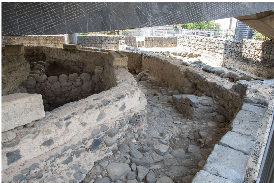
Izrael, Kafarnaum, dom Szymona Piotra przebudowany na Synagogę, fot. Krzysztof Koc 2019.

Dlaczego w miejscu domu Piotra w Kafarnaum nad Jeziojem Galiejskim, w którym nauczał Pan Jezus zbudowano Synagogę, zamiast Katedry?